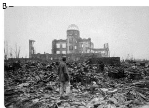
Hiroshima. Japão. 1945.