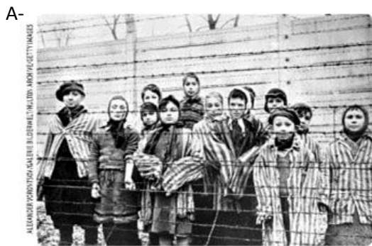
Judeus em um campo de concentração. Polônia. 1945.

10 -Observe as imagens com atenção. Elas estão relacionadas aos crimes contra à humanidade cometidos durante a Segunda Guerra Mundial. Complemente a legenda de cada uma delas.